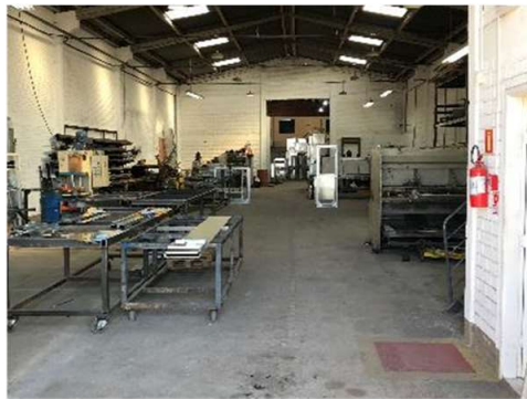
Área de Corte e Vinco