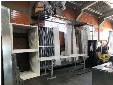
Área Separação p/ Clientes