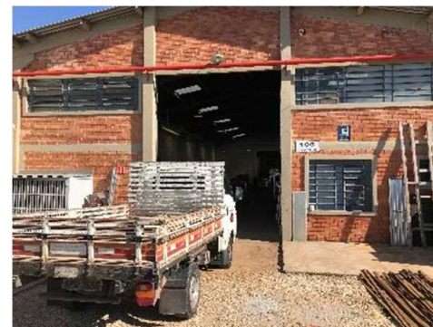
Área de Recebimento de Materiais