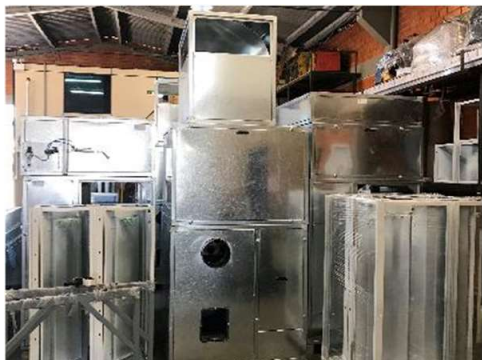
Área Separação p/ Clientes