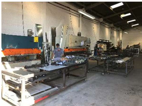
Área de Corte e Vinco