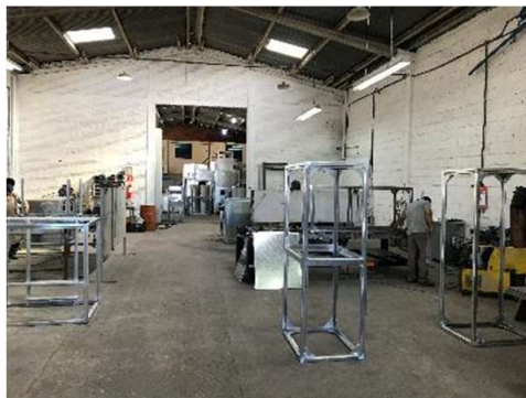
Área de Montagem e Estrutura