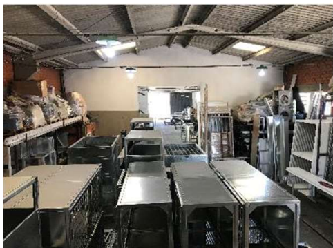
Área de Estoque Produto Final e Expedição