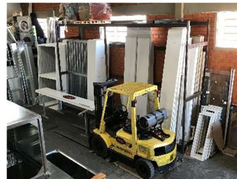
Área Separação p/ Clientes