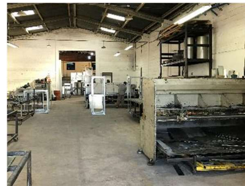
Área de Corte e Vinco