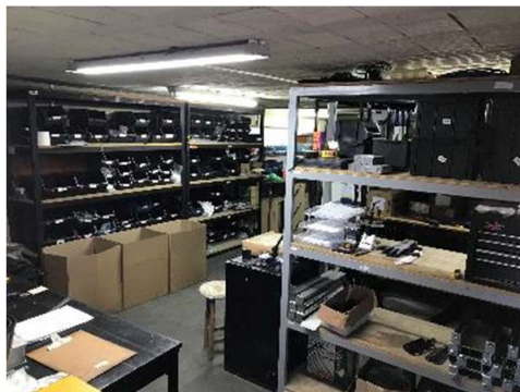
Almoxarifado e Montagem de Painel Elétricos